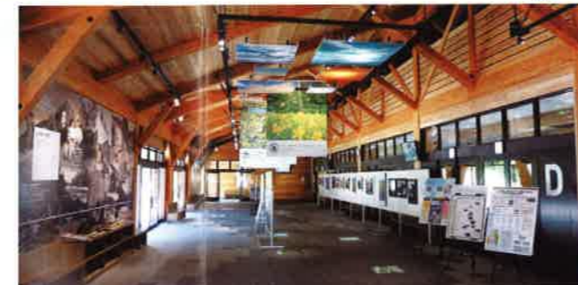
沢渡ナショナルパークゲート