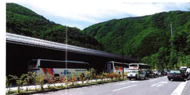
沢渡バスターミナル